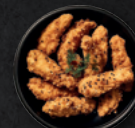
TENDERS x4 4.00