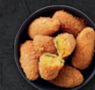
JALAPENOS x5 4.00