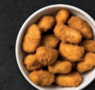
NUGGETS x5 4.00