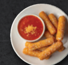
STICKS MOZZA x5 4.00